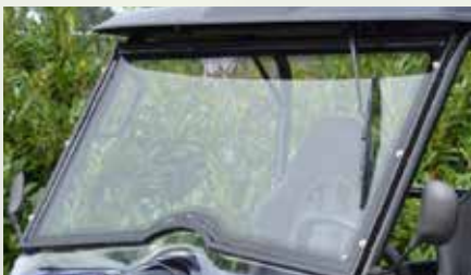
Leffert Frontscheibe aus Glas mit Scheibenwischer