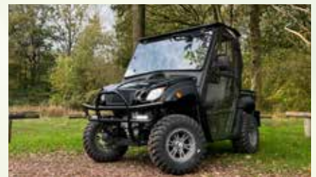
Leffert Kabine mit Heizung